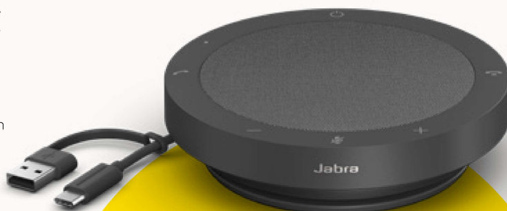
MS TEAMS- EN UC-VARIANTEN

Om een bijdrage aan de bescherming van onze planeet te leveren, denken we in elke fase van de productontwikkeling aan duurzaamheid. De buitenkant van de Speak2 40 is gemaakt met meer dan 50% duurzame materialen** en beschikt over een aantal ingebouwde onderdelen die kunnen worden gerepareerd of vervangen. Betere duurzaamheid = langer meegaande luidsprekers = nog jarenlang geweldige gesprekken voor jou en je team.